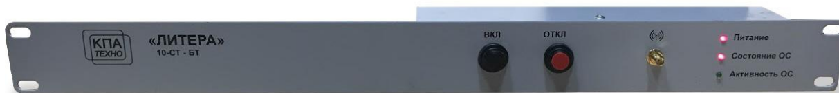
Рис.1 Передатчик субтитров