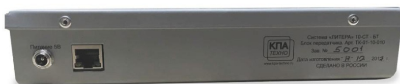
Рис.2 Задняя панель передатчика субтитров

Индивидуальный приемник субтитров (рис.3), предназначен для приема и воспроизведения на встроенном дисплее передаваемых передатчиком субтитров.