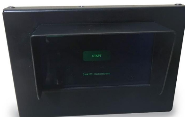
Рис.3 Приемник субтитров

Индивидуальный приемник субтитров (рис.3), предназначен для приема и воспроизведения на встроенном дисплее передаваемых передатчиком субтитров.